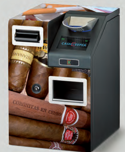
Imanes para soporte publicitario