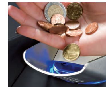
Acepta y verifica 4 monedas por segundo