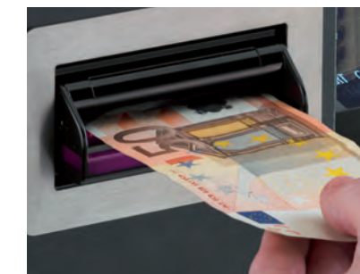
Todos los billetes aceptados son auténticos